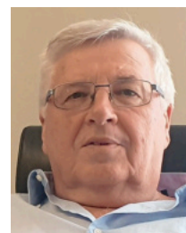
◀ Sommereiners Bürgermeister Karl Zwierschitz (SPÖ).